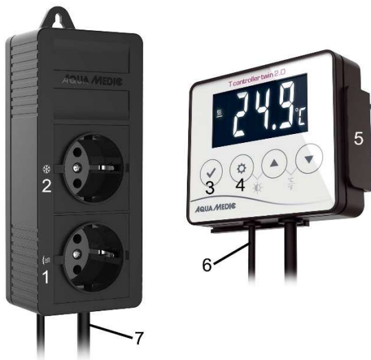
Fig. 1: T controller twin 2.0 PRO