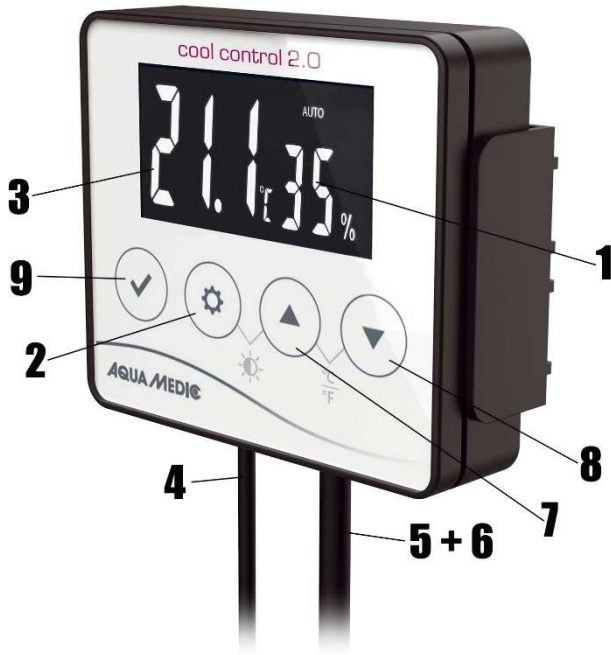
Fig. 1: cool control 2.0