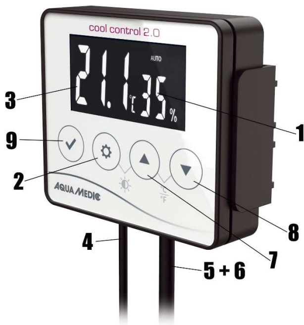
Fig. 1: cool control 2.0